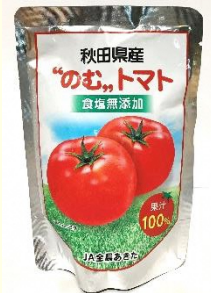
のむトマト 食塩無添加 【180g 138円】

トマトジュースは抗酸化作用のあるリコピンが多く含まれます。りんご酢ウォーターもすっきりとした味わい。夏におすすめです！