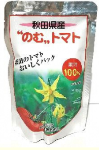
のむトマト 【180g 138円】