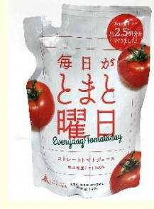
毎日かごとまと曜日 【150g 178円】