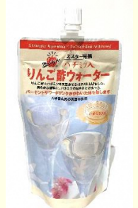
りんご酢ウォーター 【180ml 216円】