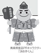
青森県産品PRキャラクター「決め手くん」