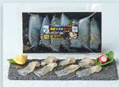
熟成ひらめ生ハム