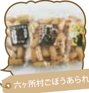
六ヶ所村でぼうあられ