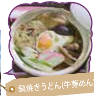
鍋焼きうどん(牛蒡めん)

特産のながいも、ごぼうが人気。豊富な加工品やメロン入りのソフトクリーム、ごぼう餃子、ごぼうかりんとう、牛蒡めんなどが好評です!