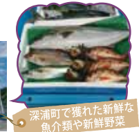
深浦町で獲れた新鮮な魚介類や新鮮野菜

深浦の獲れたての魚介類や新鮮野菜等、まるごとご用意しています。食堂の海鮮丼や日替わりランチもオススメです。