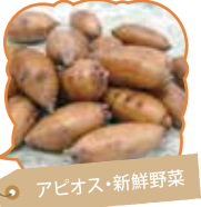
アピオス・新鮮野菜

甘くておいしいだけでなく世界三大健康野菜と言われ、非常に栄養価の高いアピオスを通年販売しています。