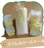
ぶりん&ロールケーキ

ブランドとうもろこし「嶽きみ」や嶽きみスイーツ、青森りんご、新鮮な果物や野菜をお手頃価格で提供。