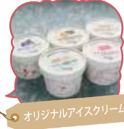
オリジナルアイスクリーム

地元産の鮮魚と野菜、食堂ではシャモロックラーメン、東青5つの特産品を取り入れたオリジナルアイスクリームも販売中です。