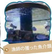
漁師の獲った魚介類

地元漁師が朝獲った新鮮な魚を購入できる産直施設となっております。皆様のご来店、スタッフ一同心よりお待ちしております。