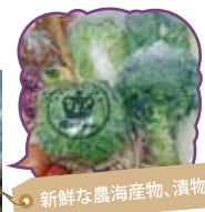
新鮮な農海産物、漬物

近隣地場産の農海産物や加工品(漬物、惣菜)、花卉、お土産など多種類の商品を販売しています。