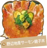
野辺地産サーモン親子丼

野辺地産活ホタテの他、県産魚介類を販売。イトインでは北前井や活ホタテ丼などの海鮮メニューを提供しています。