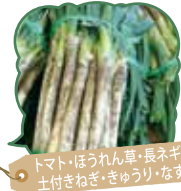
トマト・ほうれん草・長ネギ・土付きねぎ・きゅうり・なす

新鮮安心安全の地元野菜をお値打ち価格にて、まとも買いのお客様も多数、皆様の来店をお待ちしております。