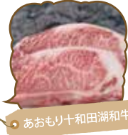
あおもり十和田湖和牛

農家の朝採れ野菜や加工品、あおもり十和田湖和牛や奥入瀬ガリックポーク等のブランド肉に新鮮な海産物が豊富に並びます。