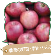
季節の野菜・果物・りんご