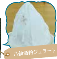
八仙酒粕ジェラート

階上岳の登山口にある施設です。地元の生乳を使ったジェラートや、手打ちの階上早生蕎麦が大人気です。