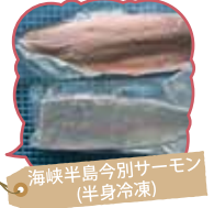
海峡半島今別サーモン(半身冷凍)

今別産の地場産品等を取り揃え販売。季節の野菜・果物、加工品、前浜で採れた「モズク」や「サーモン(冷凍)」等販売。