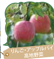
りんご・アップルパイ・高地野菜