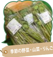
季節の野菜・山菜・りんご