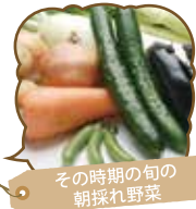
その時期の旬の朝採れ野菜

出品者の方々が、季節に応じた様々な朝採れ新鮮野菜を持って来られます。その新鮮さとお値段を、どうぞその目でお確かめください。