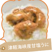
津軽海峡産甘塩うに

佐井村漁協加工品や佐井村で採れた野菜の直売所。かわいいハンドメイド品も人気です。