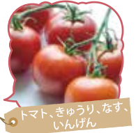
トマト、きゅうり、なす、いんげん

地元で生産された新鮮で安全安心な野菜を販売しています。その他、りんごや花卉、加工品などを提供しています。