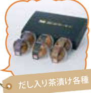
だし入り茶漬け各種

津軽海峡の冬の荒波に揉まれ育った海峡サーモン。水煮、お茶漬け、皮チップスなど様々な加工品を購入できます。