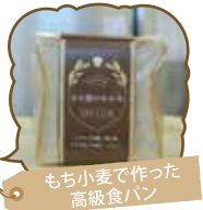
もち小麦で作った高級食パン

観光農園のハウス内で栽培されているイチゴやパパイア・バナナなどのフルーツをはじめ、新鮮な野菜、加工品・お土産品など。