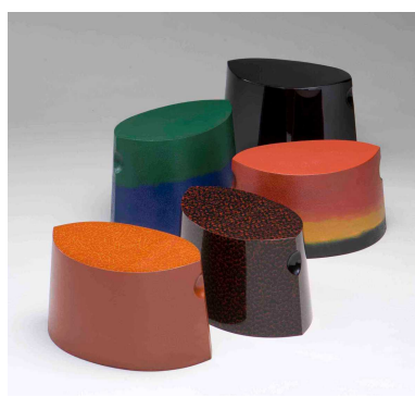
玄関のちょい掛け