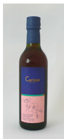
「セリジェ」「さくらリキュールひとひら」 (改良前)