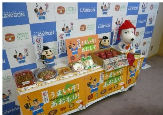
記念商品は12/16から東北6県・新潟県の802店舗で発売