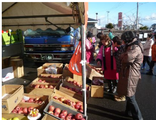
大盛況だった即売会

健全果と全く味が変わらないおいしいりんごが格安で販売されているとあって、産地直売施設は連日大勢のお客様で賑わい、売り切れを出すなど、大盛況でした。