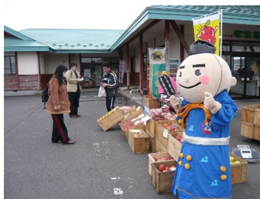
決め手くんも応援しました。