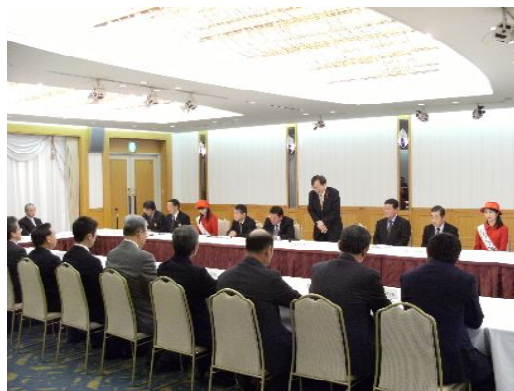
意見交換で青果会社への販売要請(名古屋)