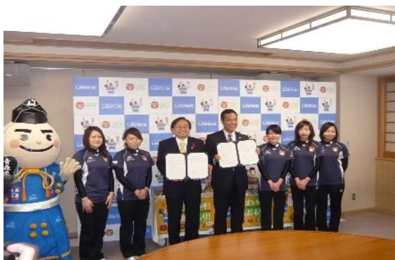
協定を締結した三村知事、新浪社長とチーム青森メンバー、決め手くん

12月15日(月)、三村知事とローソン新浪社長出席のもとに県庁で執り行われた締結式では「青森県産イカ焼きそば」や「青森県産豚の煮込み豚丼」など県産食材を使用した包括協定記念商品(5アイテム)の発売が発表されたほか、カーリング女子「チーム青森」のメンバー5人と決め手くんが駆けつけ、記念商品をPRしました。