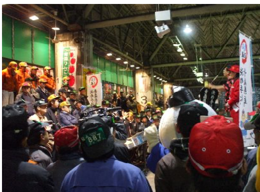
セリ台で市場関係者へPR(福岡)

今後、年明けの1月下旬からは、全国で青森りんごのキャンペーンがー斉に行われることになっており、お客様に対して広く「青森りんご」をPRしていくことにしています。