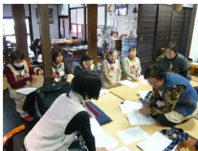
高森委員(手前)による現地アドバイス応募商品を真剣に評価する審査員