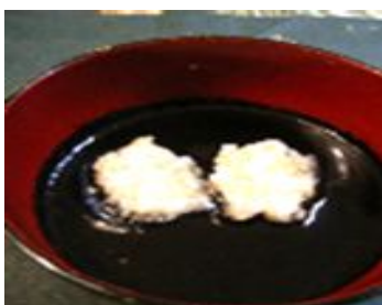
つぶゆきおかき入黒ごましろこ