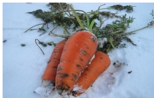
収穫されたばかりのふかうら雪人参