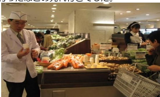
ふかうら雪人参の生ジュースをどうぞ!

試食したお客様からは、非常に香り豊かで美味しいという評価で、予定販売数量を上回り、急遽追加発注を行ったほどの売れ行きでした。