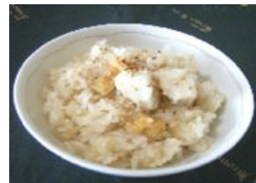
つくなが1号の炊き込みご飯