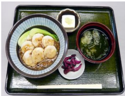
マーボーほたて丼