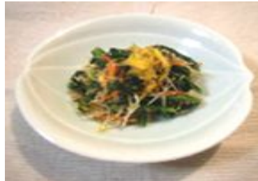
大鰐温泉もやしと春菊の中華風辛子胡麻和え