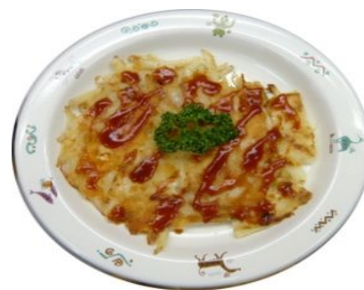
じゃがいもとホタテのかりかり焼き