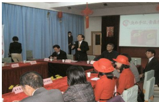
新発地農産品市場においてプレゼンテーション

今後も、りんごをはじめとする農林水産物の輸出ルートチャンネルを増やし、輸出拡大を図るために、引き続き関係団体と一体となった販売促進や消費宣伝を行うこととしております。