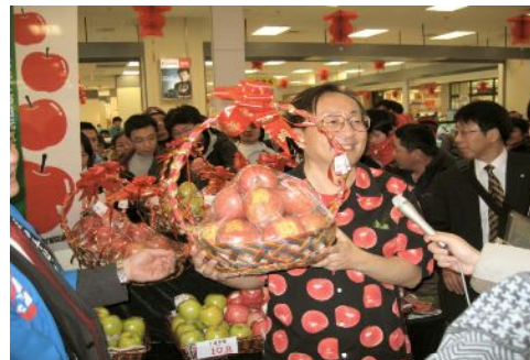
「青森県フェア」でのPR