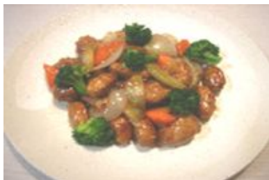
アピオスとふかうら雪人参の酢豚

今後も、情報発信力の高い団体等と連携し、青森県産品の情報発信を行っていく予定です。