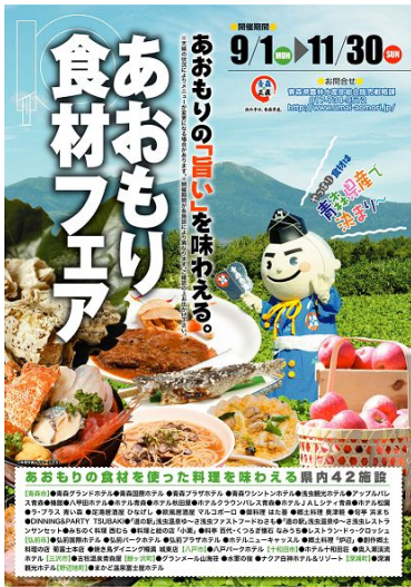
フェアの告知ポスター 街で見かけたら要チェック!

皆さんも、プロのシェフの手で美味しい料理に生まれ変わった県産食材を味わってください。なお、メニューの提供期間は参加店ごとに異なりますので、ホームページなどでご確認のうえ、足を運んでください。