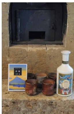
プレゼント商品「走れメロスセット」