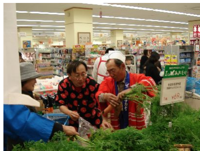
こだわりの人参(特別栽培農産物)の説明に力が入る生産者