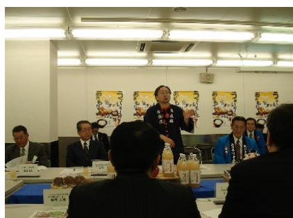
県産品の素晴らしさをPRする知事

また、セレモニーに先立ち、JA全農あおもり、JA津軽みらい、JAアオレン、青森県ぎょれん販売(株)、(有)青森県農産物生産組合などとイトーヨーカ堂グループとの情報交換会が開催され、それぞれの生産物等のPRが行われました。今後の取引拡大に期待が寄せられます。