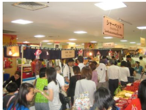
2008年1月31日～2月10日に開催された前回のタイ・バンコク物産展の様子