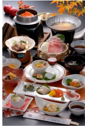
まかど温泉富士屋ホテル(野辺地町)「薬膳茶ぶ茶ぶ」