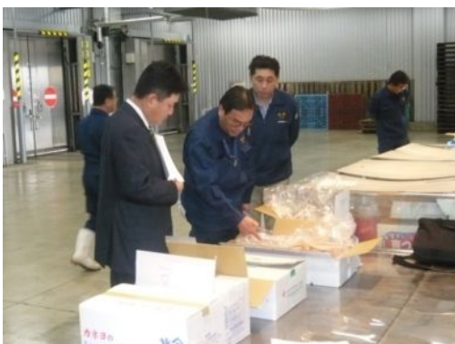
青森中央卸売市場でベビーボイルホタテの商談

物産展は年明け1月22日(木)～2月1日(日)まで、タイ・バンコクの伊勢丹タイランドにて開催されます。また、この期間中に現地日本食卸売業者を対象とした県産品の商品提案会を行い、タイでの県産農水産物の販売促進を図っていきます。