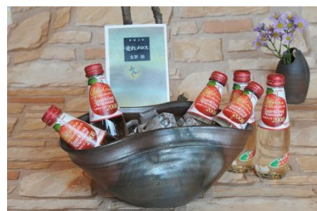
プレゼント商品「津軽セット」